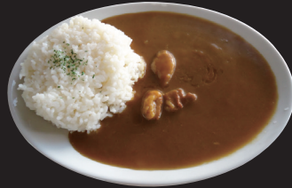
スパイシービーフカレー

スパイシービーフカレー 甘みの後からスパイスのパンチが口の中に 広がるビーフカレー。