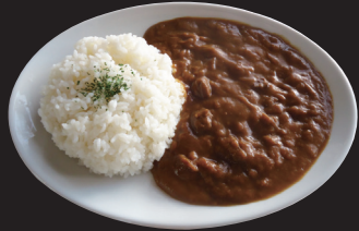
美味しいビーフカレー