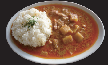
マッサマンカレー

マッサマンペースト使用。 主にタイ南部で食べられている甘みのある カレー。「イスラム教の」という意味。少し 甘みを感じるカレーです。サツマイモ使用。